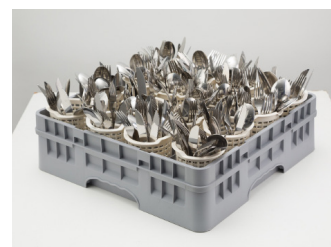
01 suporte para até 240 talheres. (Ref.: GT16)