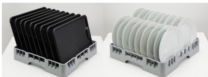
01 Gaveta com capacidade para 18 pratos ou 09 bandejas. (Ref.: GP)