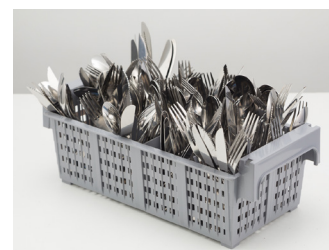
01 suporte para até 120 talheres.