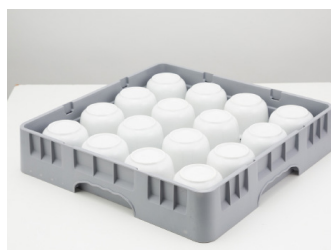
01 gaveta para louças especiais.