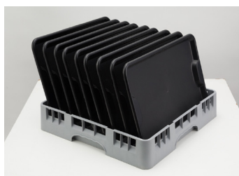
01 Gaveta com capacidade para 18 pratos ou 9 bandejas. (Ref.: GP)