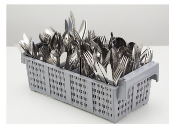
01 Suporte para até 120 talheres.