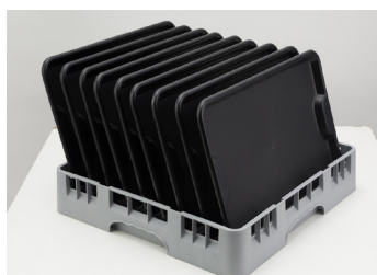
02 Gavetas com capacidade para 18 pratos ou 9 bandejas. (Ref.: GP)