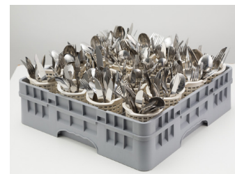
01 Gaveta com 16 copos plásticos capacidade para 240 talheres (Ref.: GT16)