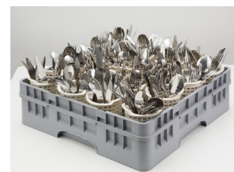
01 Gaveta com 16 copos plásticos capacidade para 240 talheres (Ref.: GT16)